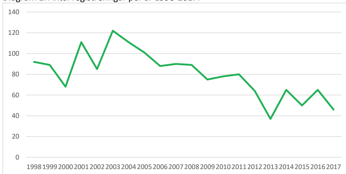
Diagram 1. Antal registreringar per år 1998-2017.

Antalet registreringar har halverats under en 20-årsperiod. Under de senaste fem åren, 2013-2017 har det i medeltal registrerats 53 strävhairiga foxterrier per år i Sverige. Det innebär att rasen är mycket nära att räknas till en av de numerärt små terrierraserna, där Svenska Terrierklubben har satt under 50 registreringar i medel per år under de senaste fem åren.